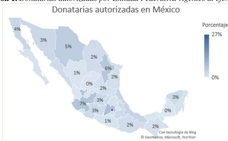
Ilustración 1. Donatarias autorizadas por Entidad Federativa vigentes al ejercicio 2021