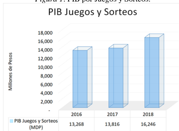
Figura 1. PIB por Juegos y Sorteos.