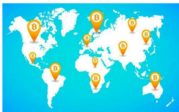
Figura 1: Países con mayor movimiento de Bitcoins al mes