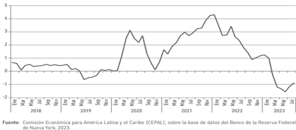
Figura 2. Índice de presión de la cadena mundial de suministro, enero de 2018 a julio de 2023