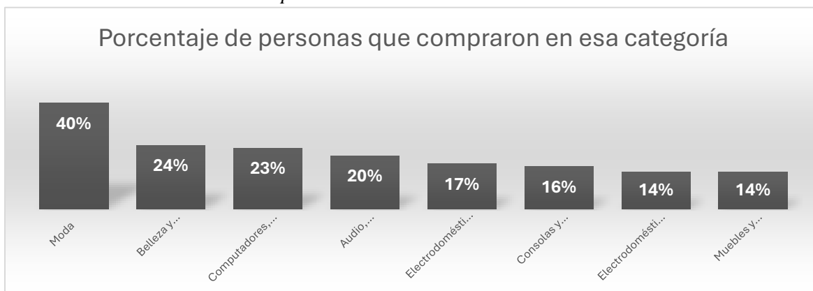
Gráfico 1. Productos más comprados en línea durante la edición 2023 del Hot Sale en México

Nota. Elaboración propia con datos obtenidos de la Asociación Mexicana de Ventas Online